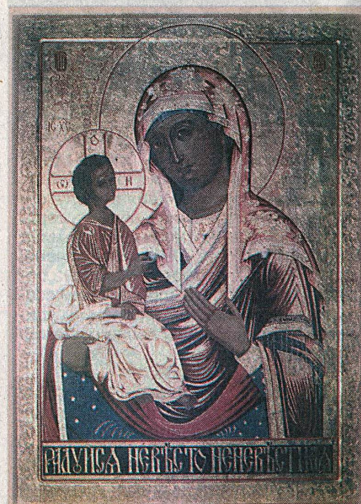
Богоматерь Иерусалимская, икона