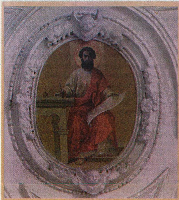
Св. Апостол Марк, роспись в храме